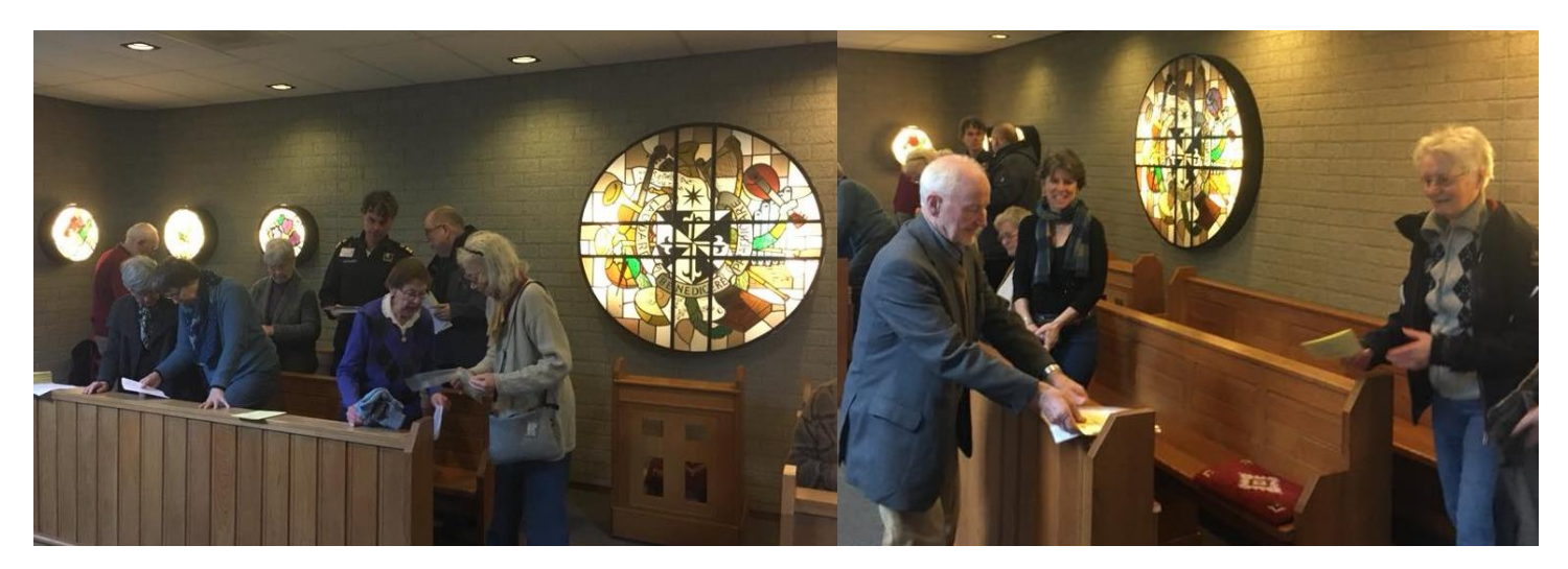
Photo 7: 2018, praying in the chapel of the local hospital (no longer exists).

Throughout the years of Friday noon-time prayer, a certain cohesion has formed, and a real 'community' has taken shape. The prayer is open to all and has been a space for some who have not felt at home in a conventional church. It has served as a means for some to rediscover the faith of their childhood. Contact amongst the "Coventry goers" has even led to some individuals emotionally and spiritually supporting each other in their times of crisis.