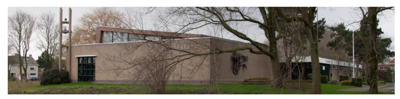
Photo 10: Location of our 10th Year Anniversary, the "Peace Church" in De Schooten, Den Helder.

On November 1<sup>st</sup>, we will be celebrating 10 years of Praying the Litany for Peace and Reconciliation in Den Helder. It will take place in the Vredeskerk, "Peace Church" which has a history of active ecumenical participation.